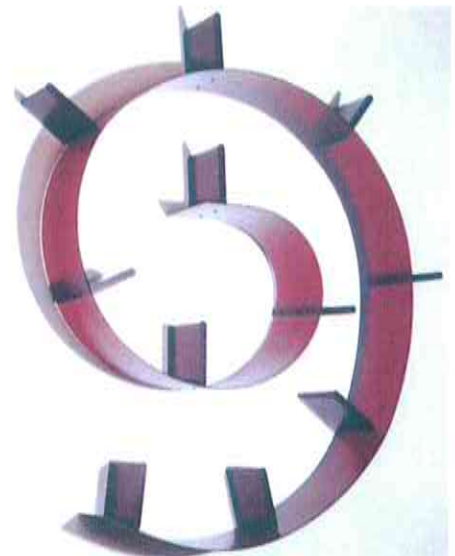
Ron ARAD, Bookworm, 1993