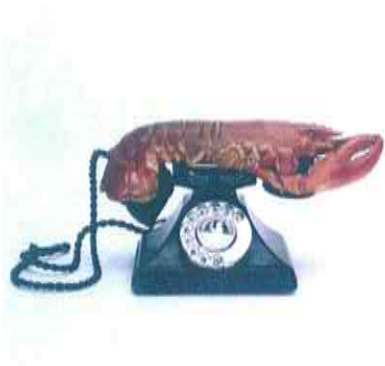
Salvador DALI, Téléphone homard, vers 1936