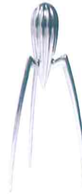
Philippe STARCK, Juicy Salif, 1988