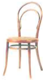
Michael THONET, Chaise n°14, bois