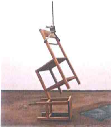
Philippe RAMETTE, Le suicide des objets, le fauteuil, 2001

Classez chacune de ces images selon les catégories suivantes : SCULPTURE ou DESIGN DE PRODUIT . Inscrivez votre réponse en dessous de chaque image.