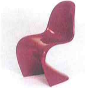
Verner PANTON, Chaise Panton, plastique

1 est la valeur la plus ancienne, 4 est la valeur la plus récente.