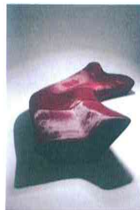
Zaha HADID, Canapé Moraine, 2000