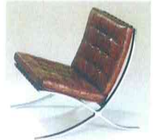
Ludwig MIES VAN DER ROHE, Chaise Barcelone, cuir et métal